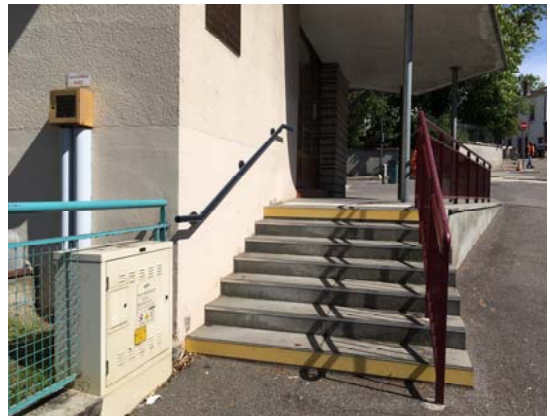
Ecole maternelle Prévert

- Les travaux de démolition / reconstruction d'une salle de classe à l'école maternelle Jacques Prévert ont retardés la mise en accessibilité du bâtiment initialement prévue en 2016. Depuis, un sanitaire accessible a été mis en conformité et des flashs lumineux ont complété le dispositif d'alarme incendie. Ces travaux se sont achevés en septembre 2017.