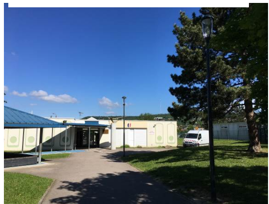
Ecole maternelle Delaunay

- L'éclairage public de la cour de l'école maternelle Delaunay a été remplacé par des lampes de type LED et mieux réparties le long du cheminement. Un guidage aveugle a été mis en place depuis l'entrée du site jusqu'à la porte principale du bâtiment.