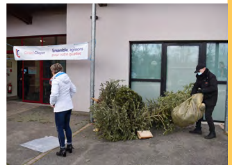
Recyclage des sapins de Noël