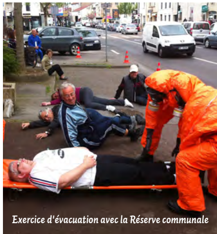
Exercice d'évacuation avec la Réserve communale

Pour s'y engager, il suffit de remplir le formulaire d'inscription proposé en ligne sur le site internet de la ville : www.esseylesnancy.fr ou de prendre contact avec le pôle services aux citoyens à l'hôtel de ville au 03 83 18 30 00.