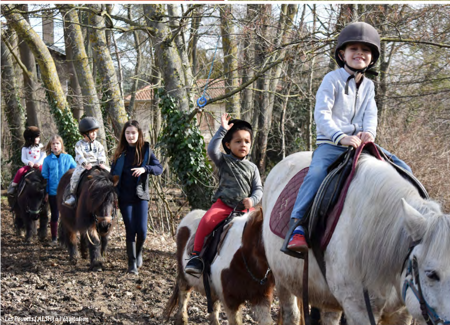
Les Poucets (ALSH) à l'équitation