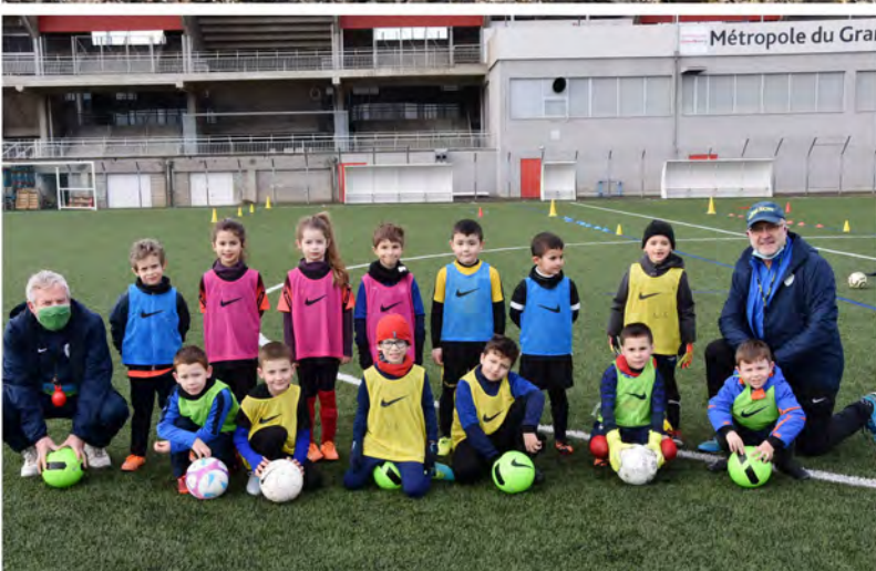
École de football, les U6/U7