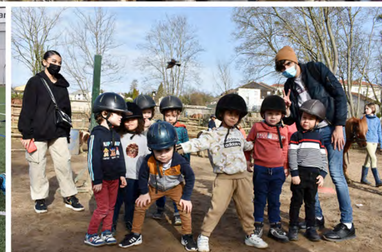
Les Poucets (ALSH) à la ferme équestre