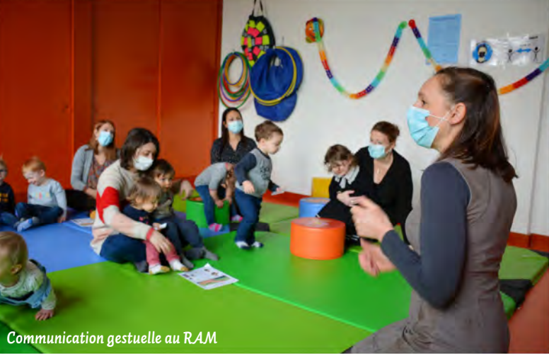
Communication gestuelle au R.A.M