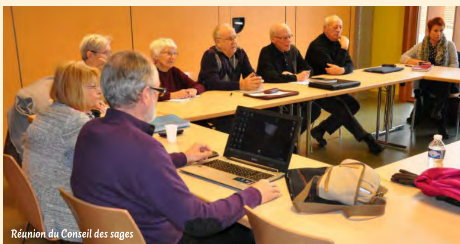
Réunion du Conseil des sages

En place depuis 2016 sur le quartier de Mouzimpré, le Conseil citoyen est composé d'habitants et d'acteurs locaux et est directement associé aux projets du quartier. Si la crise sanitaire a malheureusement mis un coup d'arrêt à ses activités depuis quelques mois, le Conseil citoyen a permis d'organiser et de pérenniser plusieurs manifestations telles que « Festi'Lune » et « Mouzim'propre ».