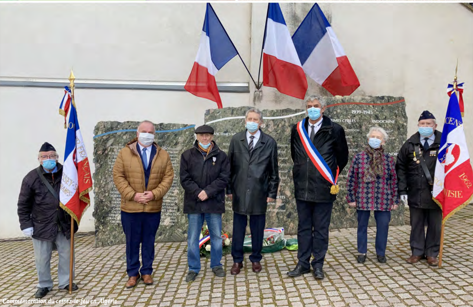
Commemoration du cessez-le-feu en Algérie