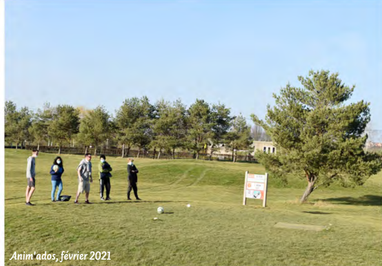
Anim'ados, février 2021