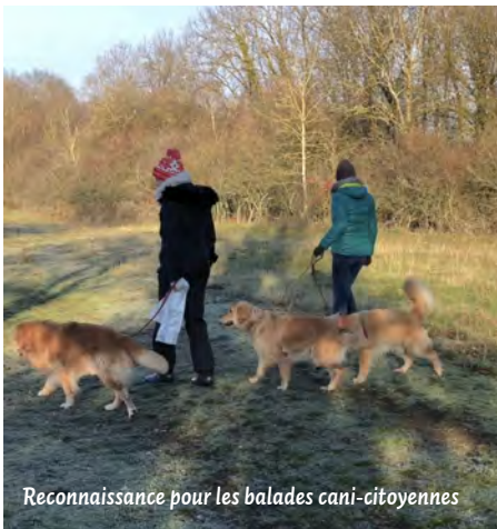
Reconnaissance pour les balades cani-citoyennes

Dès que les conditions sanitaires le permettront, des initiatives citoyennes en faveur de l'environnement verront le jour : des promenades cani-citoyennes avec l'association « 4 pattes, un sourire », des actions de nettoyage collectif de la butte Sainte-Geneviève mais également une marche citoyenne à laquelle tous les habitants seront invités à participer. (Plus de renseignements à venir sur le site de la ville).