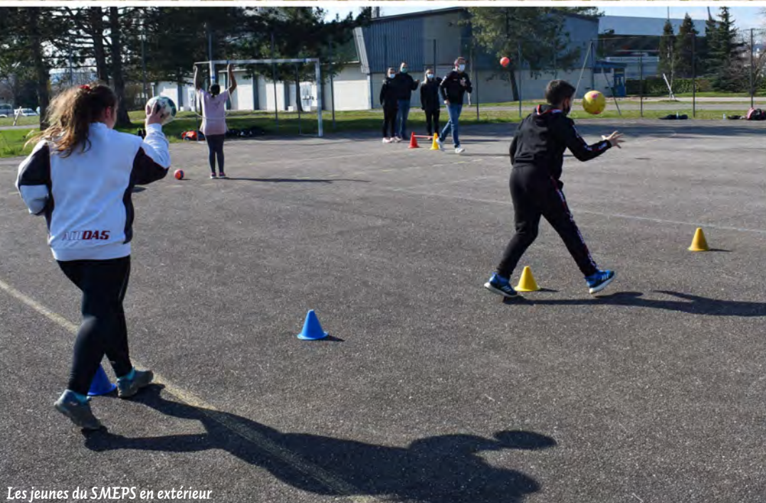
Les jeunes du SMEPS en extérieur