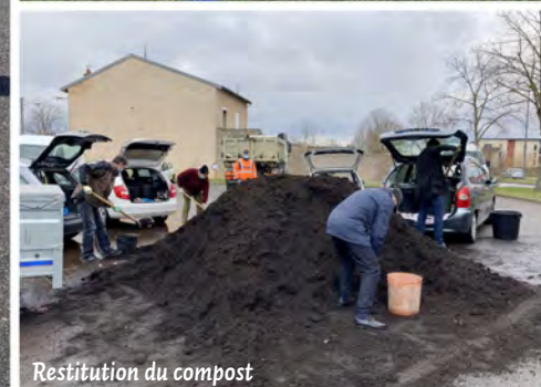
Restitution du compost