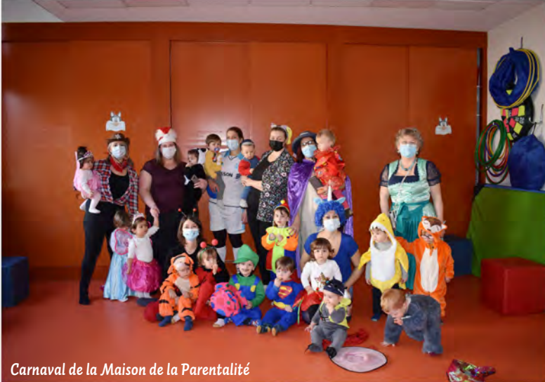
Carnaval de la Maison de la Parentalité