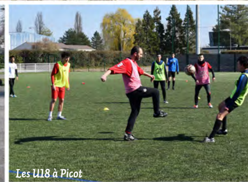
Les U18 à Picot