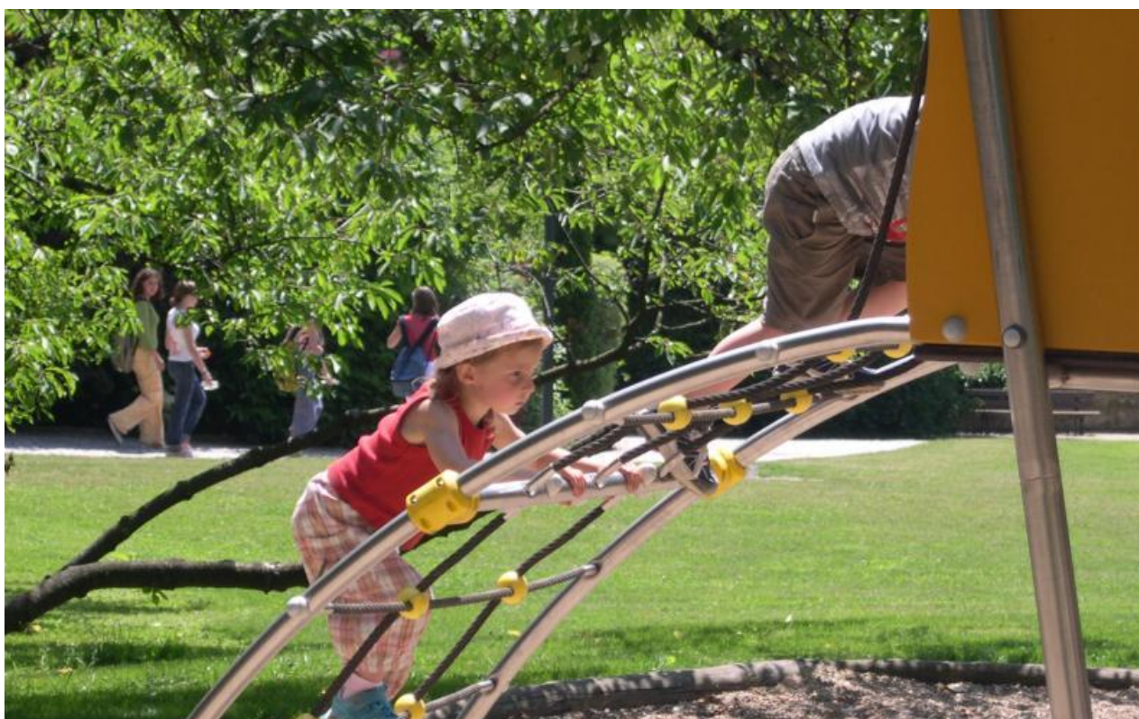
Jeux du parc du Haut-Château

L'utilisation des jeux doit toujours se faire sous la surveillance d'un adulte.